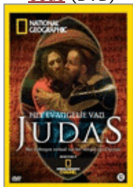
Het Evangelie van Judas (DVD)