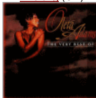
Very Best Of Oleta Adams (CD)