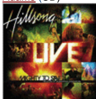
Mighty To Save (CD)