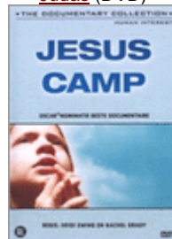
Jesus Camp (DVD)