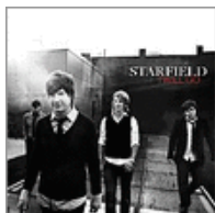
I Will Go