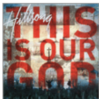
This Is Our God