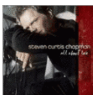
All About Love